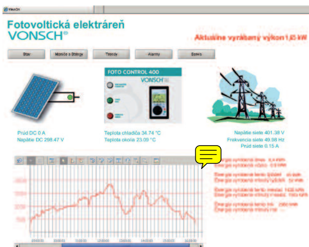
Príklad monitoringu fotovoltaickej elektrárne VONSCH

PLC – VIPA programovateľný automat VIPA slúži ako MASTER na komunikačnej zbernici MODBUS a zároveň je k nemu možné pripojiť signály so snímačov teploty panelov, osvetlenie, prípadne iné. PLC zhromažďuje údaje z viacerých meničov, vyhodnocuje sumárne výkony a sprostredkovať ich cez RS485 – MP21 pre EWON.