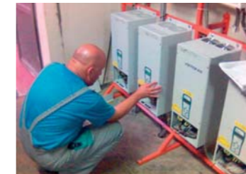
Frekvenčné meniče VONSCH – kaskádové riadenie

Podrobné informácie o väčších aplikáciách v teplárenstve nájdete na www.vonsch.sk/referencie – vyhľadávanie podľa odvetvia – teplárenstvo.