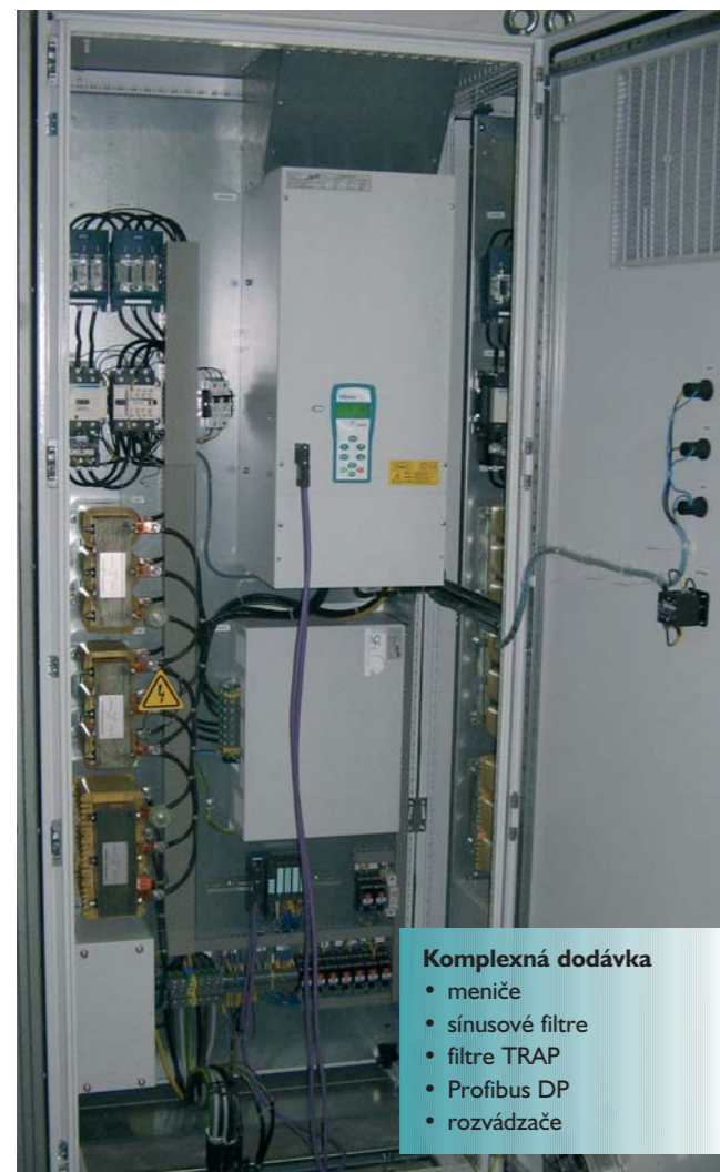
Regulácia dymového a vzduchového ventilátora horúcovodného kotla